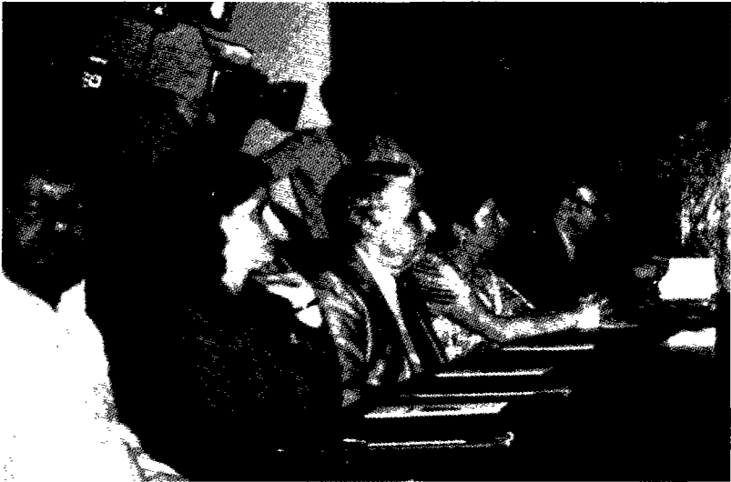
Once de los veinte firmantes son fotografiados en el momento de ofrecer el Manifiesto